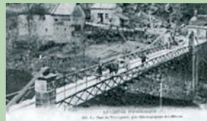
Le pont de Vernéjoux

Durant les années 1950 les premiers aménagements hydroélectriques sur la Dordogne débutèrent (barrage de Marèges), une aventure qui marqua la fin d'une époque pour la vallée et le début de sa métamorphose.