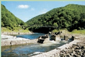
Site de Vernéjoux

Une randonnée qui, du plateau du Champagnais, vous guide vers les gorges de la Dordogne. Une rivière légendaire, autrefois tempétueuse, dont les rives abruptes abritent encore une nature riche et sauvage.